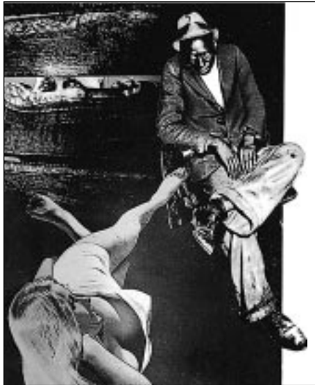
Figura 4. Una imagen de Josep Renau.