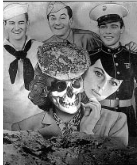
Figura 5. Otra imagen del artista valenciano Josep Renau.