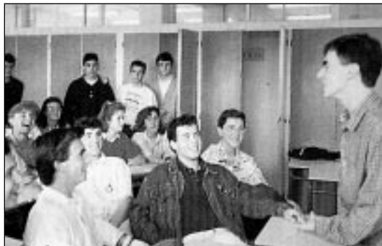
Figura 1. La idea del trabajo parece divertida.